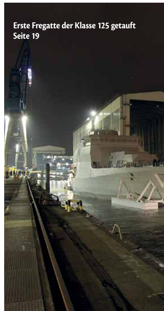
Erste Fregatte der Klasse 125 getauft Seite 19