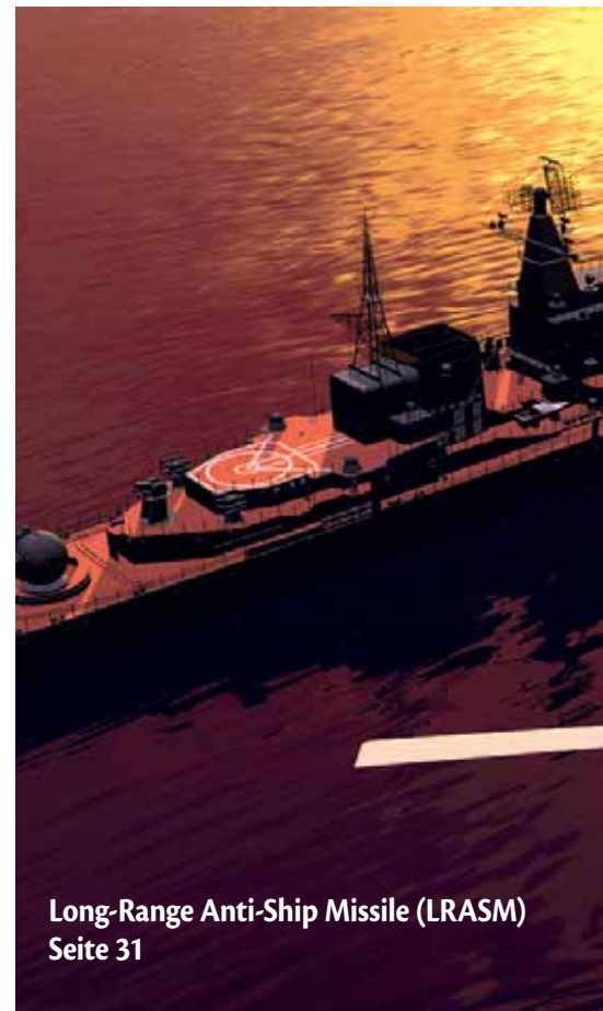
Long-Range Anti-Ship Missile (LRASM) Seite 31